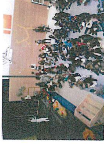
Schulversammlung der MS West